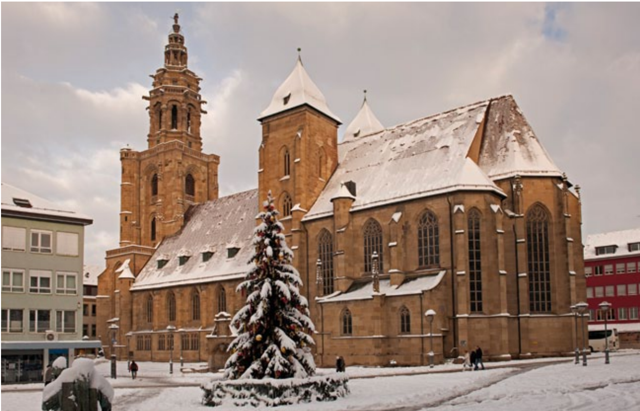
Pünktlich zum Heiligen Abend fiel im vergangenen Jahr jede Menge Schnee, der – zum Glück für die Baustelle auf dem Kiliansplatz – in diesem Jahr noch ausgeblieben ist.

Stadt Heilbronn · Marktplatz 7 · 74072 Heilbronn