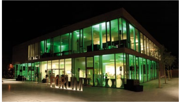
Hochwertige Architektur und exzellente Bildungsangebote vereint der Bildungscampus der Dieter Schwarz Stiftung.

der Stadt von 2,6 Millionen Euro, ansonsten aber komplett privat finanzierte Campus bietet nicht nur Synergieeffekte zwischen den Institutionen, sondern auch exzellente Bildungsprogramme, die von der frühkindlichen Bildung bis zum berufsbegleitenden Hochschulstudium reichen. Auf dem Bildungscampus haben die German Graduate School of Management and Law (GGS), die Akademie für Innovative Bildung und Management Heilbronn-Franken (aim) und der Campus Heilbronn der Dualen Hochschule Baden-Württemberg Mosbach (DHBW, die frühere Berufsakademie) jetzt einen idealen Standort unweit der Innenstadt gefunden. Entstanden ist daneben auch ein neues Parkhaus.