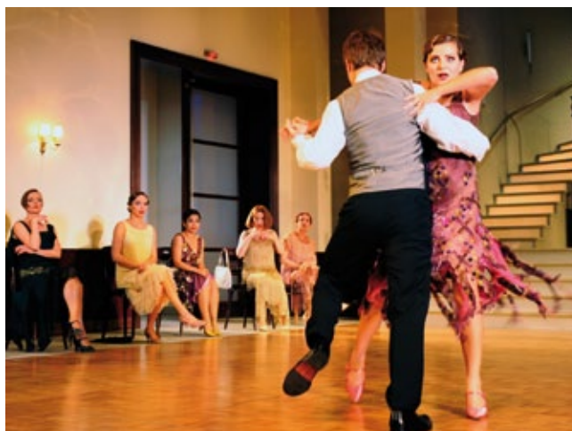
„Das Ballhaus“ gehört in der laufenden Spielzeit zu den Publikumslieblingen am Theater Heilbronn.

Und was hat sich in der Kultur in Heilbronn in diesem Jahr getan? Erwähnt seien hier nur vier Beispiele: Nach wie vor überaus positiv verläuft die Entwicklung an unserem Theater. Die dritte Spielzeit in Folge stiegen die Besucherzahlen: Fast 160000 Besucher sahen die 520 Vorstellungen in den drei Spielstätten. Auch in der laufenden Spielzeit 2011/2012 ist die Tendenz weiterhin sehr positiv, was auch überregional anerkannt wird. So ist das Theaterfachmagazin „Die Deutsche Bühne“ in der Rubrik „Ungewöhnlich überzeugende Theaterarbeit abseits großer Zentren“ voll des Lobes über die Arbeit am Berliner Platz.