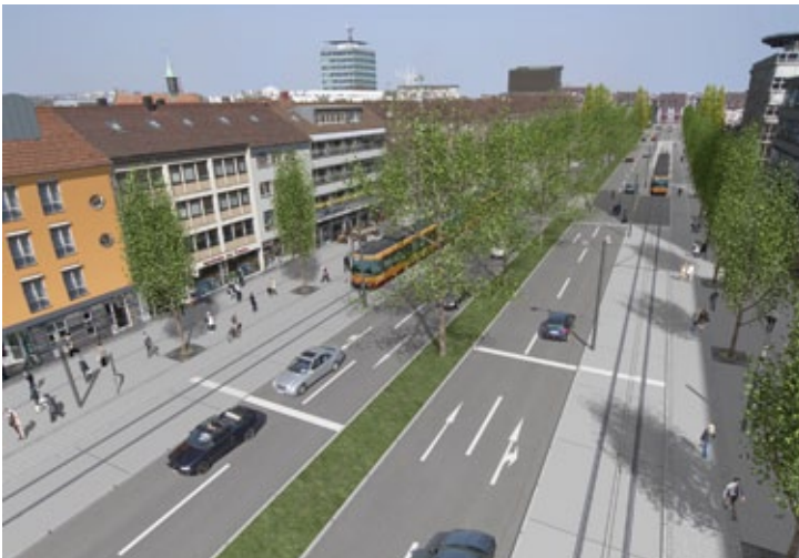
Drei Baumreihen werden der Allee ihren Boulevardcharakter zurückgeben, wenn 2013/2014 die erste Stadtbahn Richtung Norden fährt.

Wie Sie meinen letzten Weihnachtsbriefen entnehmen konnten, waren bereits die vergangenen Jahre durch große Veränderungen und Aufbrüche geprägt, wenn ich nur an die Stadtgalerie (2008) auf dem ehemaligen Landerer-Areal, das Kaufhaus am Kiliansplatz (2009) auf dem ehemaligen Klosterhof-Gelände, an die Lern- und Erlebniswelt experimenta (2009) im und am ehemaligen Hagenbucher oder an die Kunsthalle Vogelman (2010) beim Konzert- und Kongresszentrum Harmonie denke. Im zu Ende gehenden Jahr gilt dies noch in weit stärkerem Maße: Heilbronn ist mehr denn je eine Stadt im Aufbruch. Hier gilt mein Dank auch den Bürgerinnen und Bürgern, die ohne großes „Bruddeln“ die Einschränkungen, die während der Bauphase mit manchen Großprojekten verbunden sind, in Kauf nehmen.