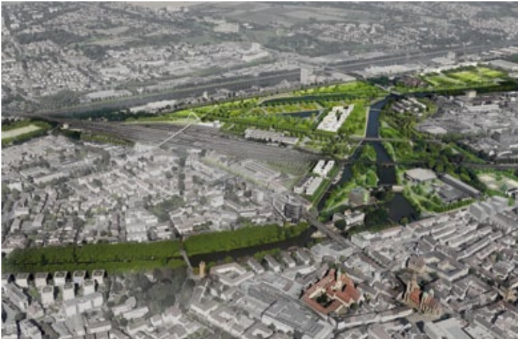
Das Jahrhundertprojekt Buga mit der Entwicklung des neuen Stadtteils Neckarbogen nimmt konkrete Formen an.

Neckarbogen, dem früheren Fruchtschuppenareal hinter dem Hauptbahnhof. Die Baufelder des künftigen Stadtviertels sind zunächst als Gärten ausgebildet. Das nördliche Ufer eines geplanten Freizeitsees wird zur ökologischen Zone, die sich entlang des Neckars bis ins Wohlgelegen zieht. Für den Bereich Theresienwiese/Frankenstadion wird der zweite Preisträger, das Büro RMP Stephan Lenzen Landschaftsarchitekten (Bonn), eingebunden. Das Büro schlägt vor, den Festplatz Theresienwiese Richtung Frankenstadion zu verlagern und die gewonnene Fläche als neuen Park für die Bahnhofsvorstadt zu nutzen. Der dritte Preis, der an das Büro bbz Landschaftsarchitekten (Berlin) ging, ist für den Bereich Böckingen/Sonnenbrunnen interessant. Beim Eisenbahnmuseum soll ein