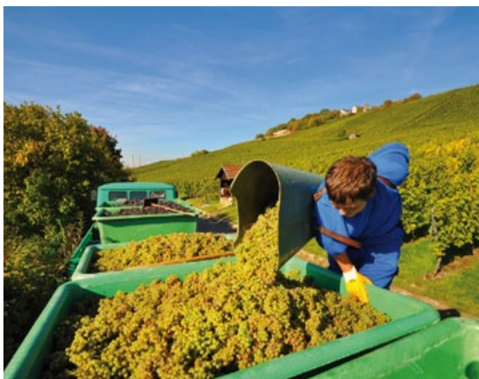
Kein einfaches Jahr haben die Heilbronner Wengerter hinter sich.

Als das Weindorf, das wiederum sehr gut besucht war, von keinem Geringeren als EU-Kommissar Günther H. Oettinger am 9. September eröffnet wurde, war die Lese bei vielen Betrieben längst im Gange. Dem traditionellen Fest wie auch dem Fest am Wartberg tat dies jedoch keinen Abbruch, zumal einmal mehr die Qualität der hiesigen Tropfen stimmte, was auch der Württemberger Weingipfel in diesen Tagen eindrucksvoll bestätigt hat. Leider wurden manche Wengerter in diesem Jahr Opfer von dreisten Traubendieben.