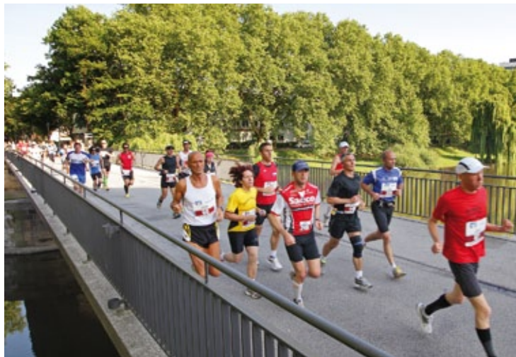
Nach wie vor erfreut sich der Heilbronner Trollinger-Marathon großer Beliebtheit.