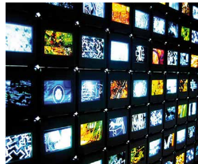
Dietmar Müller, see you to remember, 2010 180 x 45 x 15 cm, Filmgravur

Allée 43 | T_07131/3901731 →→ Sa 15-24 Uhr, So 11-19 Uhr