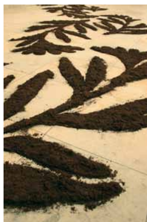
Peter Riek, Ornament und Verbrechen 2010, Bodenzeichnung, Tonf, Foto: Peter Riek