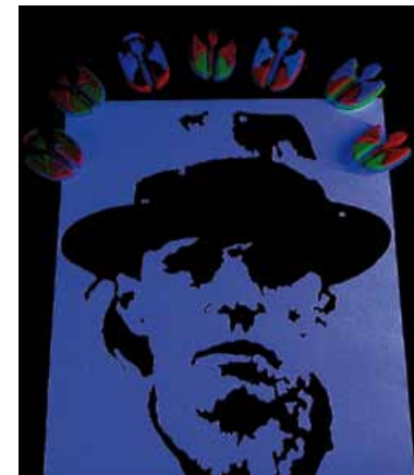
Günther Zitzmann, Heilige und Scheinheilige (Ausschnitt), © G. Zitzmann

Achtungstraße 37 | T_07131/873000 →→→ Sa 15-24 Uhr, So 11-19 Uhr