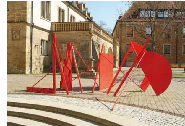
Bernd Hennig, Arche, 1984, Stahl, lackiert

Deutschhofstraße 6 | T_07131/562295 →→→ Sa 11-20 Uhr, So 11-17 Uhr