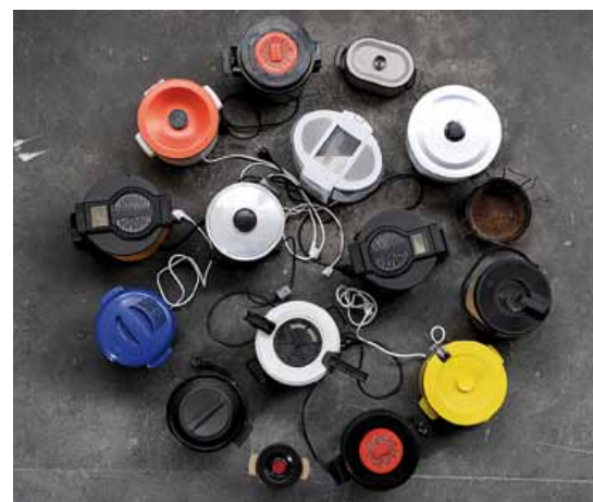
Matthias Schamp, Partizipatorisches Kunstprojekt Stuttgart 2010, Ballerina, Foto: Matthias Schamp Matthias Schamp, Fritteusenfarbkreis 2009, Foto: Olaf Ballnuss

Der Künstler frittirt und reflektiert persönlich am Kunstwochenende. | Sa 15–24 Uhr und So 11-19 Uhr