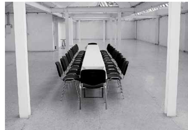
Installationen, 06, ZIGARRE, © K. Schaeffer

Genauere Zeit- und Ortsangaben sowie detaillierte Beschreibungen entnehmen Sie bitte dem ZIGARRE-Flyer.