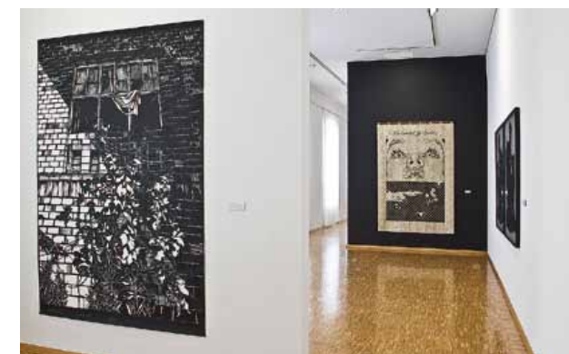
Blick in die Ausstellung „Scherenschnitte heute“