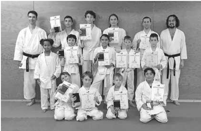
Teilnehmer der Gürtelprüfung der Karateabteilung am 8.12.2023

Haben Sie Interesse? Informationen zu unserer Abteilung finden Sie unter https://www.svhn1891.de/index.php/abteilungen/karate/abteilungswebseite-karate .