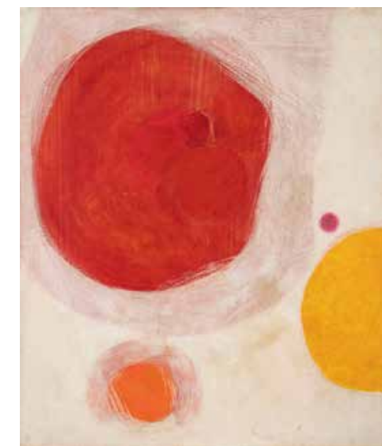
Hal Busse, Rote Sonnen (verschieden groß), um 1962