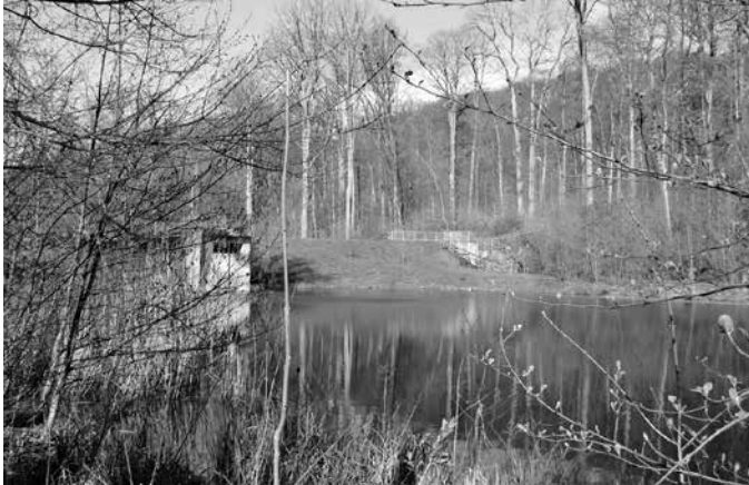
Ein Blick auf den Köpferstausee mit dem Hochwasserdamm und dem Auslassbauwerk im hinteren Bereich.

Nach der mehrtägigen Sicherheitsprüfung wird der Köpferstausee wieder mit Wasser über den Köpferbach und eine Quelle aufgefüllt. Dies wird mehrere Wochen dauern. Spätestens Ende Januar soll der See wieder mit Wasser gefüllt sein. Der Köpferstausee wurde 1933 durch den Reichsarbeitsdienst errichtet und ist im Laufe der Jahre mehrmals saniert worden. Die letzte Sanierung erfolgte im Jahr 2005.