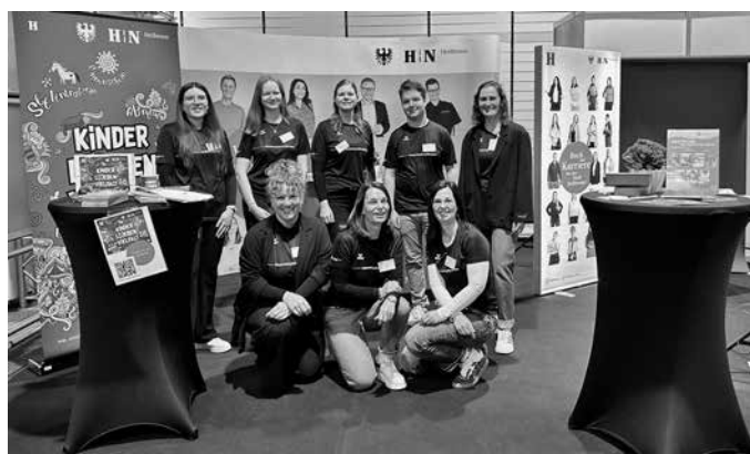
Auch das gehört zur Ausbildung dazu: Ein Stand der Stadt Heilbronn auf der Bildungsmesse im Red Blue wurde im Mai 2025 von Azubis und Kolleginnen aus den Ämtern betreut.

Auch auf der Homepage und auf Social-Media-Kanälen der Stadt werden Informationen aufbereitet. Die Reihe „Job des Monats“ auf Instagram ( instagram.com/heilbronn_de ) ist erfolgreich und zeigt mit anschaulichen Videos den Arbeitsalltag in Berufsfeldern. Ein neues Azubi-Projekt unter dem Titel „Win-Win“ kommt ebenfalls gut an. Hier werden über eine städtische Intranet-Plattform bedarfsorientiert Wissenspappen und Lern-Kniffe vor allem zu städtischen digitalen Tools vermittelt. Von den Auszubildenden wird das Fortbildungsangebot rege genutzt.