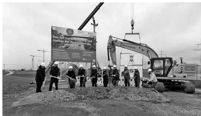
Spatenstich für die Nordumfahrung. Sie ist eines der wichtigsten Infrastrukturprojekte der Stadt Heilbronn, entlastet die Stadtteile Neckargartach und Frankenbach, verbessert die Erreichbarkeit des Industrieparks Böllinger Höfe und stellt die verkehrliche Anbindung des KI-Innovationsparks IPAI sicher.

Das Gesamtprojekt Nordumfahrung und Ausbau der Neckartalstraße umfasst ein Investitionsvolumen von rund 57 Millionen Euro. Das Land Baden-Württemberg beteiligt sich mit einem zweistelligen Millionenbetrag an der Finanzierung, aufgeteilt auf die Förderung der kommunalen Nordumfahrung und der vollständigen Finanzierung des Ausbaus der Landesstraße Neckartalstraße.