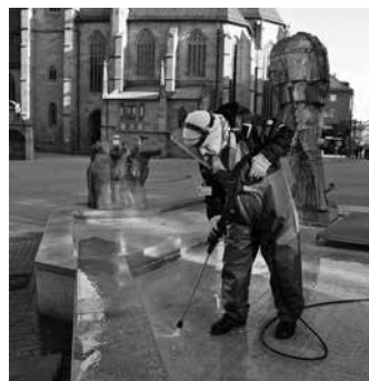
Per Dampfstrahl wird der Komödiantenbrunnen am Kiliansplatz kurz vor Ostern fit für den Betrieb gemacht.

„Wasser marsch“ heißt es bei einigen der städtischen Brunnen seit kurz vor den Feiertagen. Pünktlich zum Osterfest hat das Betriebsamt die ersten Brunnen in der Innenstadt und einige geschmückte Brunnen in den Stadtteilen in Betrieb genommen. Eine gründliche Reinigung der Brunnenflächen per Dampfstrahl und eine Prüfung der Pumpenanlage gingen dem Start voraus. Ein vierköpfiges Team kümmert sich um die Arbeiten.