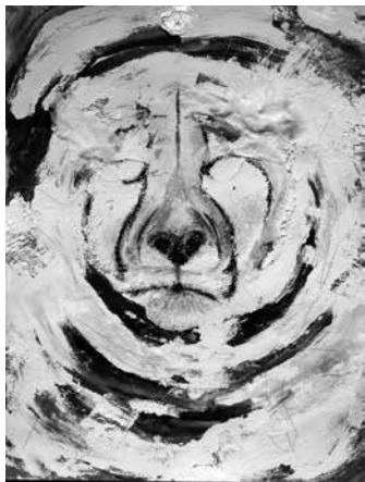
Ein Werk des Künstlers Peter Klak, das durch viele Facetten zu einem genaueren Hinsehen auffordert. (Foto: Klak)

in denen nichts endgültig verschwindet, sondern lediglich seine sichtbare Gestalt verändert.