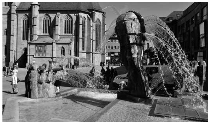
Mit Pumpenhilfe speien die Figuren im Komödiantenbrunnen wieder Wasserfontänen in die Luft.

Die meisten Brunnen funktionieren im Umlaufverfahren, in dem Wasser über unterirdische Behälter im Umlauf nach oben gepumpt wird und wieder zurückfließt. Zwischen 0,5 und zwei Kubikmeter Größe umfassen die Behälter. Trinkwasserqualität haben diese Brunnen nicht. Die meisten Brunnen laufen per Zeitschaltuhr und schalten sich abends ab.