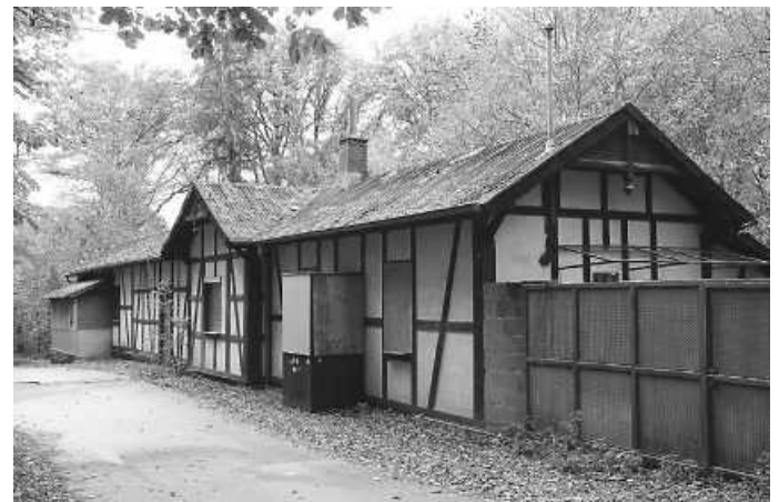
Die lange leer stehende und verfallende Waldschänke im Köpfertal wird demnächst abgerissen.

Bereits 1896 wurde die Genehmigung für einen Ausschank erteilt, nachdem dort Militärschießbahnen eröffnet worden waren. Mitte der 1970er-Jahre baute die Stadt die ehemalige Waffenkammer und den Pferdestall zur Waldschänke aus und ergänzte eine Toilettenanlage. Lange Zeit war das mitten im Wald gelegene Lokal ein beliebtes Ausflugsziel der Heilbronner Bevölkerung. Probleme mit dem mehr als 100 Jahre alten Trinkwasserbrunnen führten vor zehn Jahren zur Auflösung des Pachtvertrags zwischen dem damaligen Wirt und der Grundstückseigentümerin Stadt. Schon damals stand ein Abbruch des dem Mieter gehörenden Gebäudes im Raum, schließlich setzte sich der Wunsch aus der Bevölkerung und dem Gemeinderat nach Erhalt des Lokals durch. Weil trotz vieler Bemühungen kein Nutzer gefunden wurde, steht das Lokal seit 2012 leer, verfiel zusehends und war immer wieder Ziel von Einbrüchen und Zerstörung.