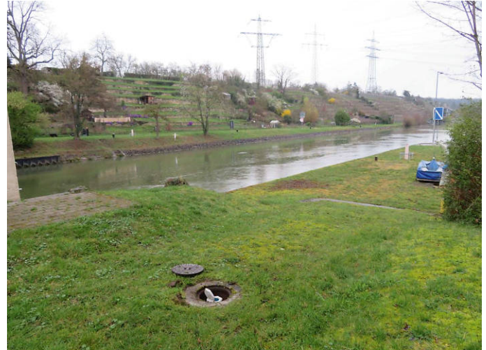
Bestandsgrundwassermessstelle am Wehr Beihingen

Das WNA Heidelberg hat die Bohrarbeiten für jeden Standort im Vorfeld mit den zuständigen Behörden abgestimmt. Bei den Bohrungen wird streng darauf geachtet, dass keine schädlichen Stoffe in das Grundwasser oder den Neckar gelangen.