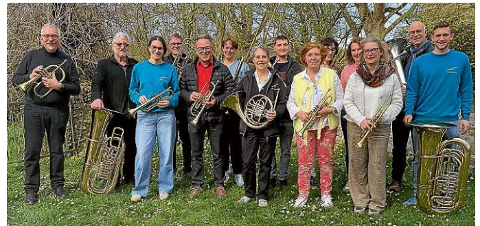
Schnappschuss im Kirchgarten

Reizt es Sie, ein Blechblasinstrument erlernen zu wollen, dürfen Sie uns gerne ebenfalls kontaktieren oder Sie kommen mittwochs ab 20.00 Uhr einfach mal im Paulusgemeindehaus vorbei.