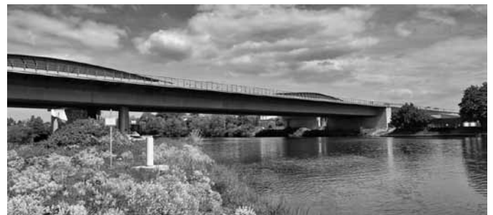
Die Neckarbrücke aus Stahl wird im Zuge des A6-Ausbaus demontiert. Mit Spezialtechnik werden die vier Teile auf Pontons abgelassen und zum Hafen ausgeschifft.

Nach dem 25. Mai – dann soll die alte Neckarbrücke Geschichte sein – beginnen die Arbeiten für den konventionellen Abbruch der Vorlandbrücke. Dabei sind dann Bagger-scheren und -meißel im Großinsatz, um die mehr als 128.000 Kubikmeter Brücke zu pulverisieren.