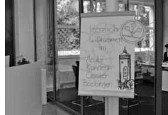
Ein freundliches Schild am Empfang weist auf das Azubi Kundencenter hin