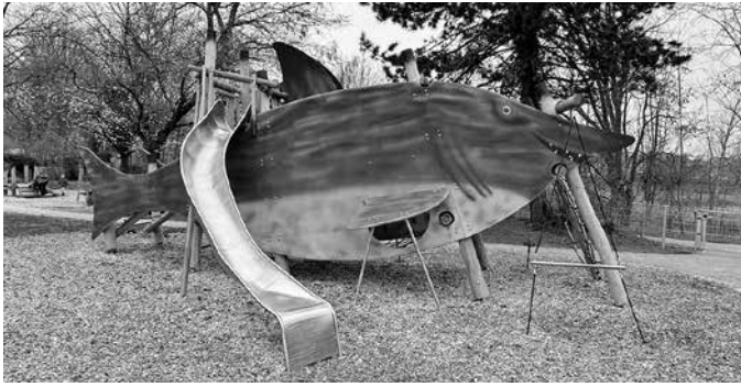
Auf dem neuen Haifisch-Klettergerüst können sich die Kinder so richtig austoben.

Die Spielgeräte auf dem Spielplatz Fischerheim mussten in den vergangenen Jahren aus Sicherheitsgründen abgebaut werden. Auch die Wege und Spielbereiche waren in die Jahre gekommen. Aufgrund des schlechten Gesamtzustandes wurde deshalb entschieden, nicht nur die einzelnen Geräte auszutauschen, sondern das Gelände neu zu konzipieren. Geplant war neben einer thematischen Ausrichtung mit modernen Spielgeräten auch, die bestehenden Wegeverbindungen zu verbessern und die vorhandene Bepflanzung besser zu integrieren.