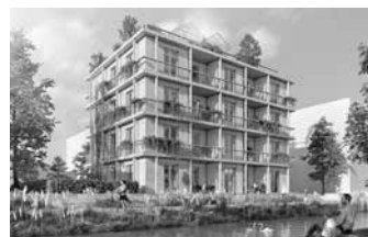
F3-Investor: HKPE Hofkammer Projektentwicklung GmbH, Ludwigsburg; Architektur: müller.architekten PartGmbH, Heilbronn

Anspruchsvolle Architektur, vielfältige Nutzungen und technische Innovationen sind das Markenzeichen von Heilbronn Stadtquartier Neckarbogen. Diese Kriterien zeichnen auch die jetzt ausgewählten sieben Arbeiten aus. Rund 20 bis 25 Prozent der geplanten Wohnungen sollen als geförderter Wohnraum entstehen, in einigen Erdgeschossflächen sind gewerbliche oder