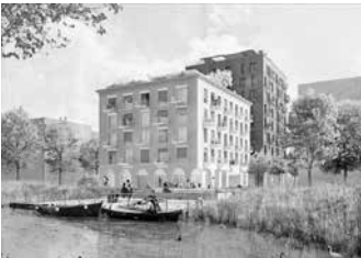
F1-Investor: Pflugfelder P Immobilien GmbH, Ludwigsburg; Architektur: Unique Studio, Stuttgart

In Heilbronn Stadtquartier Neckarbogen wird auch künftig auf hohem Niveau gebaut. Das zeigen die Planungen für sieben weitere Gebäude, deren Investoren jetzt vom Heilbronner Gemeinderat grünes Licht zur Folgeplanung erhalten haben. Baubeginn für die Gebäude mit etwa 100 Wohnungen könnte Herbst 2025 sein.