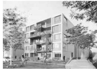
G1_Investor: BF Wohnbau Eins GmbH & Co. KG, Flein; Architektur: Krummlauf Teske Happold Architekten BDA, Heilbronn

Die drei weiteren Grundstücke sind für studentisches Wohnen vorgesehen. Die Entwürfe werden ebenfalls vom Bewertungsgremium beurteilt. Hier sind die Vorplanungen allerdings noch nicht abgeschlossen.