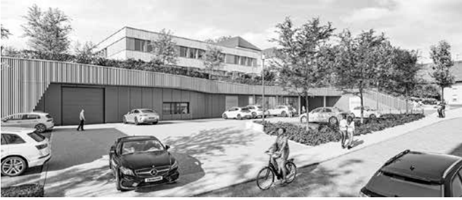
Wie in diesem Modell soll die Fläche mit Schule und Markt in Alt-Böckingen einmal aussehen. (Visualisierung: Krummlauf Teske Happold Architekten, September 2023)

Mit dem Satzungsbeschluss ist das Bebauungsplanverfahren abgeschlossen. Ein Bauantrag für den Gebäudekomplex wurde beim Baurechtsamt bereits eingereicht. Als nächstes folgen die Tiefbauarbeiten durch die Versorgungsbetriebe für Schule und Markt (Strom, Wasser, Abwasser, Kommunikationsleitungen). Die Ausschreibung für das Bauprojekt soll voraussichtlich Ende Mai bekannt gegeben werden, das Vergabeverfahren wird bis in den Herbst dauern.