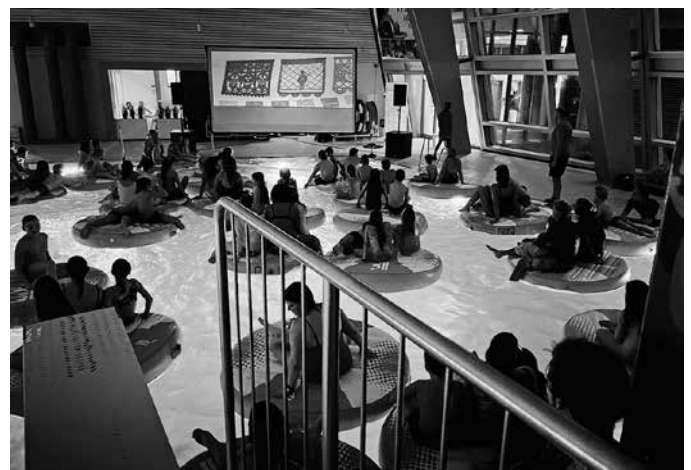
Aqua Movie Event im Soleo Heilbronn, Quelle: Stadtwerke Heilbronn

Alle Informationen und Tickets im SWHN Online-Shop unter: www.heilbronner-baeder.de