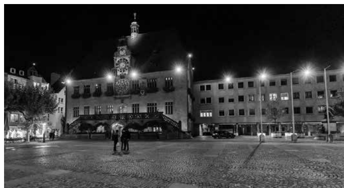
Dank der neuen leistungsstarken LED-Strahler ist der Marktplatz nun deutlich heller.

Ergänzend arbeitet die Stadt Heilbronn im Rahmen der Konzeption „Sicheres Heilbronn“ eng mit der Polizei zusammen, um das subjektive Sicherheitsempfinden rund um den Marktplatz als zentralen Aufenthaltsort zu stärken. Hierzu gehören die Aufstockung des Kommunalen Ordnungsdienstes, eine verstärkte Polizeipräsenz im Innenstadtbereich, gezielte Kontrollmaßnahmen und Präsenz von zivilen Kräften sowie weitere Maßnahmen wie Waffen- und Alkoholverbotzonen. Seit Herbst 2025 ergänzt zudem ein Videoschutz der Polizei die bestehende Sicherheitsarchitektur.