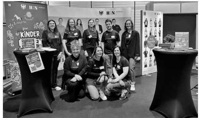
Auch das gehört zur Ausbildung dazu: Ein Stand der Stadt Heilbronn auf der Bildungsmesse im Red Blue wurde im Mai 2025 von Azubis und Kolleginnen aus den Ämtern betreut.

Kniffe vor allem zu städtischen digitalen Tools vermittelt. Von den Auszubildenden wird das Fortbildungsangebot rege genutzt.