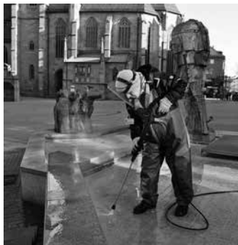
Per Dampfstrahl wird der Komödiantenbrunnen am Kiliansplatz kurz vor Ostern fit für den Betrieb gemacht.