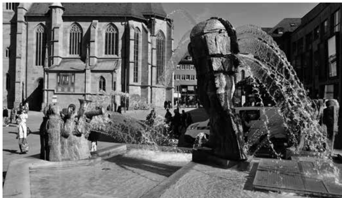
Mit Pumpenhilfe speien die Figuren im Komödiantenbrunnen wieder Wasserfontänen in die Luft.

bereit. Nach Ostern werden weitere Brunnen angeschaltet.