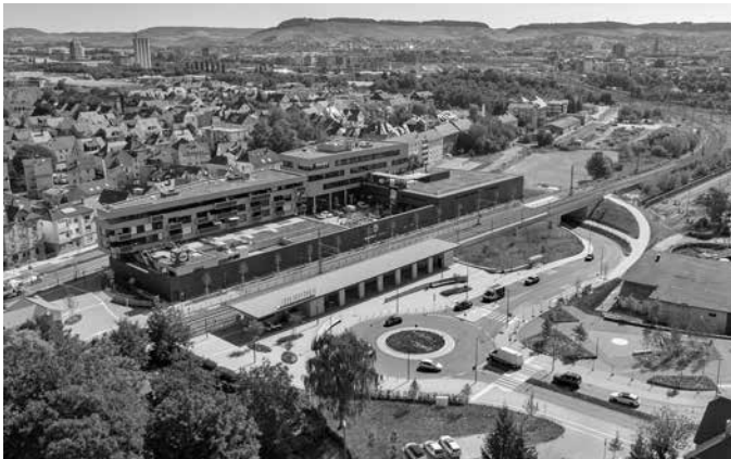
Das Bild zeigt den Mobilitätspunkt Sonnenbrunnen in Böckingen, an dem die verschiedenen Verkehrsarten wie Auto, Stadtbahn, Bus, Rad- und Fußverkehr zusammenkommen.