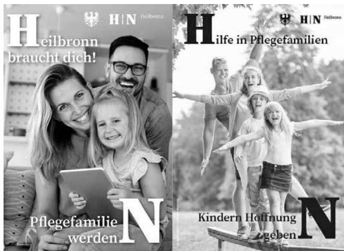
Auch mit Postkarten wirbt der Pflegekinderdienst um neue interessierte Pflegeeltern im Team. Die derzeitige Altersspanne der Pflegekinder reicht von null bis 21 Jahren.

INFO: Beim Infoabend am Dienstag, 5. Mai, 18 Uhr, stellt das Team des Pflegekinderdienstes den Alltag einer Pflegefamilie vor, geht auf Bedürfnisse, Regularien und Verfahrensschritte ein und beantwortet Fragen. Ort ist das Amtsgebäude in der Wollhausstraße 20, Raum 1.56. Anmeldung unter pkd@heilbronn.de ist erwünscht. Vorabinfos gibt es unter: www.heilbronn.de/pflegekinderdienst