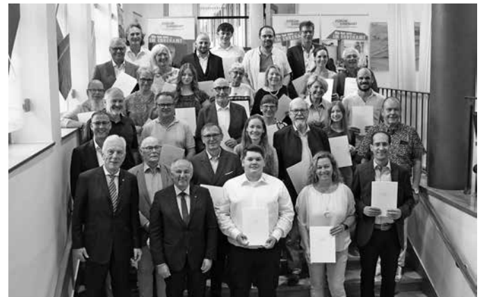
Gruppenbild mit den ausgezeichneten Bürgerinnen und Bürgern, die sich im Ehrenamt in besonderer Weise engagieren.

Baustein für das Funktionieren der Stadtgesellschaft, ein Leistungsträger und auch Vorbild für andere“, dankte er den Geehrten.