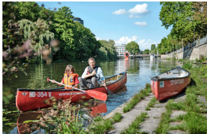
„Heilbronn zeigt Geschmack“ – Viele Aktionen rund um das Thema Neckar finden am Samstag, 16. Juli, von 10 bis 16 Uhr in der Innenstadt statt.

Ganz schön viel Oper. Sonntag, 24. Juli, 19.45 Uhr, Deutschhof.