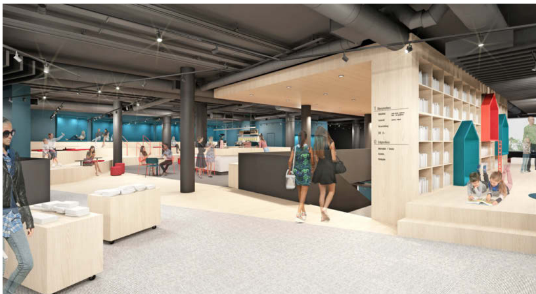
Mit dem Umbau wird die Stadtbibliothek im K3 rund 400 Quadratmeter größer und gewinnt als Aufenthalts-, Lern- und Begegnungsort. Visualisierung: Dittel Architekten