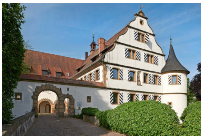
Auch für das Deutschordensschloss wünscht sich der Bezirksbeirat Kirchhausen Sanierungsarbeiten.

Drei Prüfaufträge hat das Gremium beschlossen: einen Tarif nur für das Freibad Kirchhausen, weitere Schritte zur Ortsumgebung sowie die Einrichtung eines Kreisverkehrs an der Abzweigung von der Bundesstraße 39 nach Biberach. (bra)