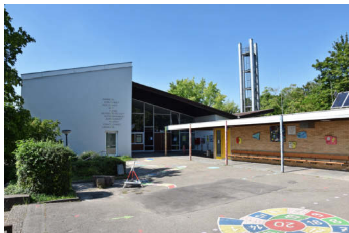
Einer von insgesamt 16 Haushaltsanträgen ist die Sanierung des Biberacher Schulhofes.

Gefordert wird zudem ein Stadtteilbudget mit vier Euro je Einwohner für kleinere Projekte und Hilfeleistungen. (bra)