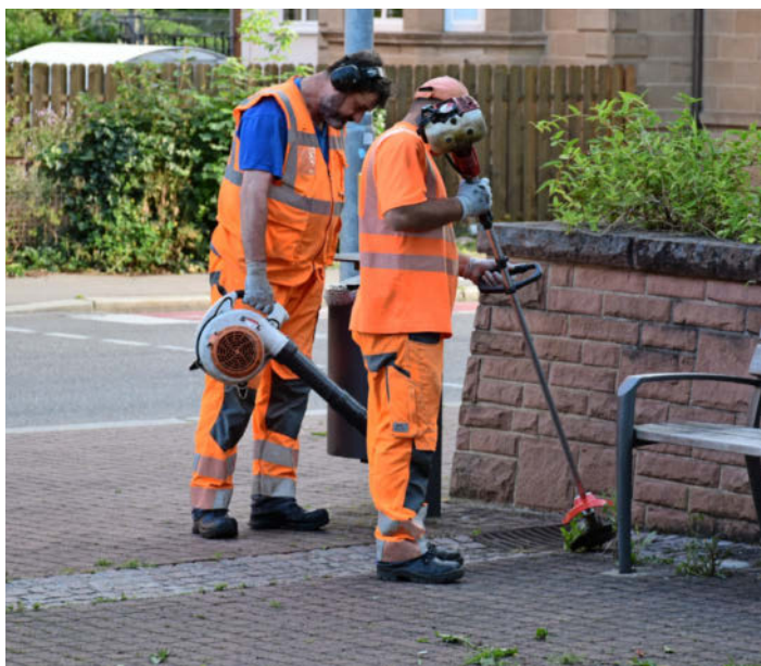
Unkraut wird vom Sonderreinigungstrupp in der Kolpingstraße mit einem Freischneider beseitigt (Foto links). Hausmüll und mehr landen häufig in Abfalleimern, die dafür nicht gedacht sind.

INFO: Infos zur Abfallentsorgung gibt die Beratungsstelle der Entsorgungsbetriebe unter www.heilbronn.de/abfallentsorgung . Zudem gibt es ein städtisches Sauberkeitstelefon unter Telefon 07131 56-4040, Hinweise können auch unter https://heilbronn.mangelmelder.de gemeldet werden.