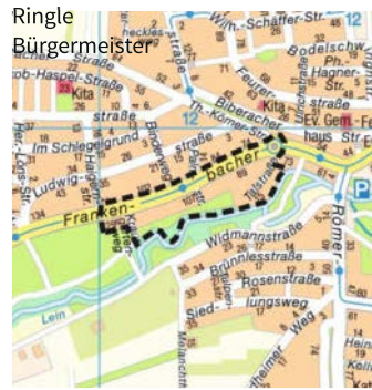
Kartengrundlage: Vermessungs- und Katasteramt

Heilbronn, 19.07.2022 Stadt Heilbronn Bürgermeisteramt In Vertretung