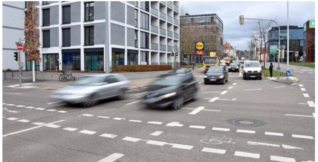
Zur Lärminderung geht jetzt die Sanierung der Südstraße weiter. In diesem Sommer steht die Erneuerung des Asphalts auf dem nördlichen Abschnitt zwischen der Urban- und der Olgastraße an.

Auch in der Ludwigsburger Straße in Böckingen wird die Fahrbahndecke unter Vollsperrung saniert. Der erste Bauabschnitt erstreckt sich vom 1. bis zum 11. August von der Einmündung Leonhardstraße bis