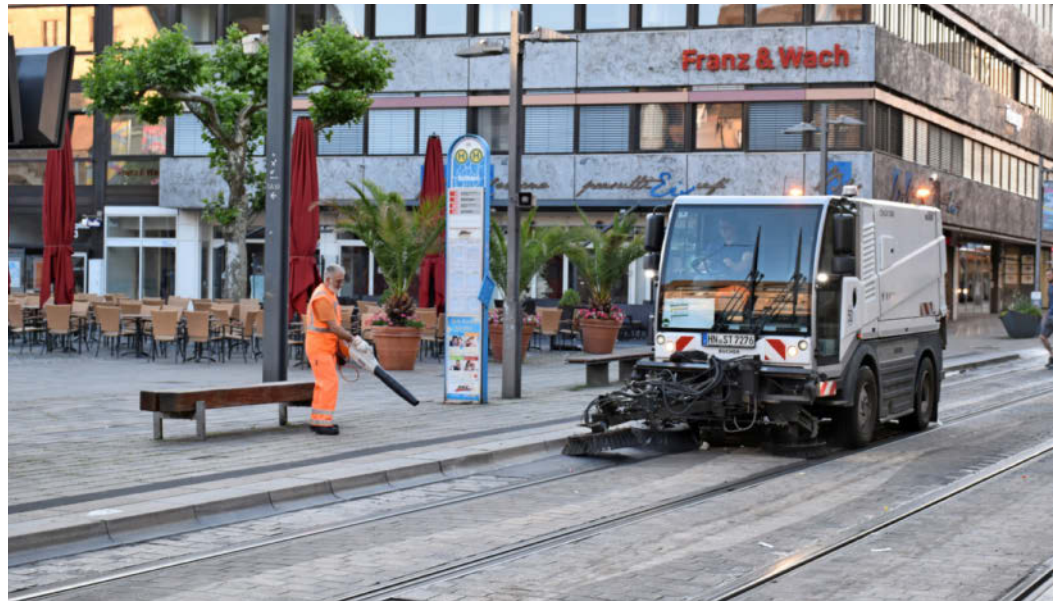
Morgens am Heilbronner Marktplatz: Herumliegender Abfall wird auf die Straßen geblasen, wo er dann von einer Kehrmaschine aufgesaugt wird.

Nach der Säuberung der großen öffentlichen Plätze werden sämtliche Straßen und Gassen gereinigt. Zur täglichen Arbeit kommen saisonale Aufgaben wie die mehrmalige Entfernung