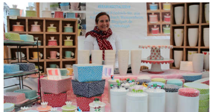
Der Kunsthandwerkermarkt zwischen Bollwerksturm und Neckarbrücke findet am Samstag, 30. und Sonntag, 31. Juli statt.