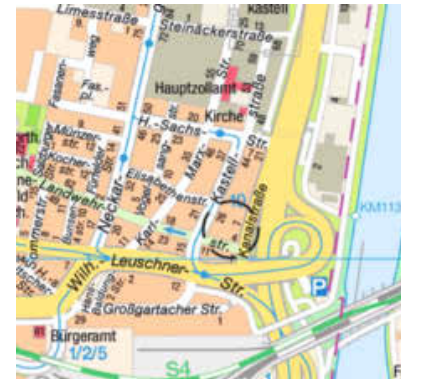
Kartengrundlage: Vermessungs- und Katasteramt