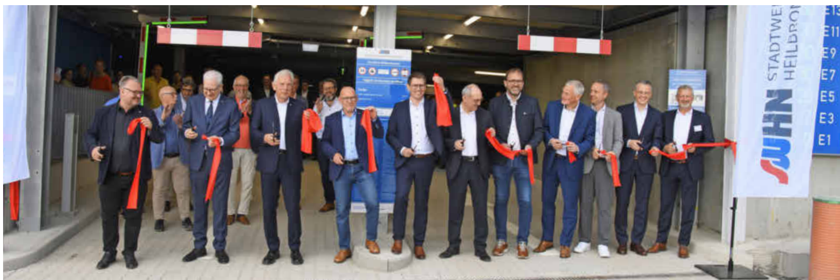
Nach rund einem Jahr Bauzeit ist die E-Quartiersgarage im Neckarbogen nun freigegeben.

Neue E-Quartiersgarage im Neckarbogen feierlich eröffnet – 643 Stellplätze mit 202 Elektro-Ladepunkten