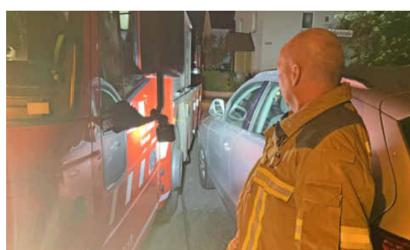
Falsch geparkte Autos stellen immer wieder im gesamten Stadtgebiet ein Hindernis für große Feuerwehrfahrzeuge dar.

Im Heilbronner Innenstadtbereich zeigten sich unterschiedliche