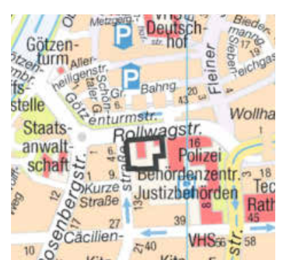
Kartengrundlage: Vermessungs- und Katasteramt