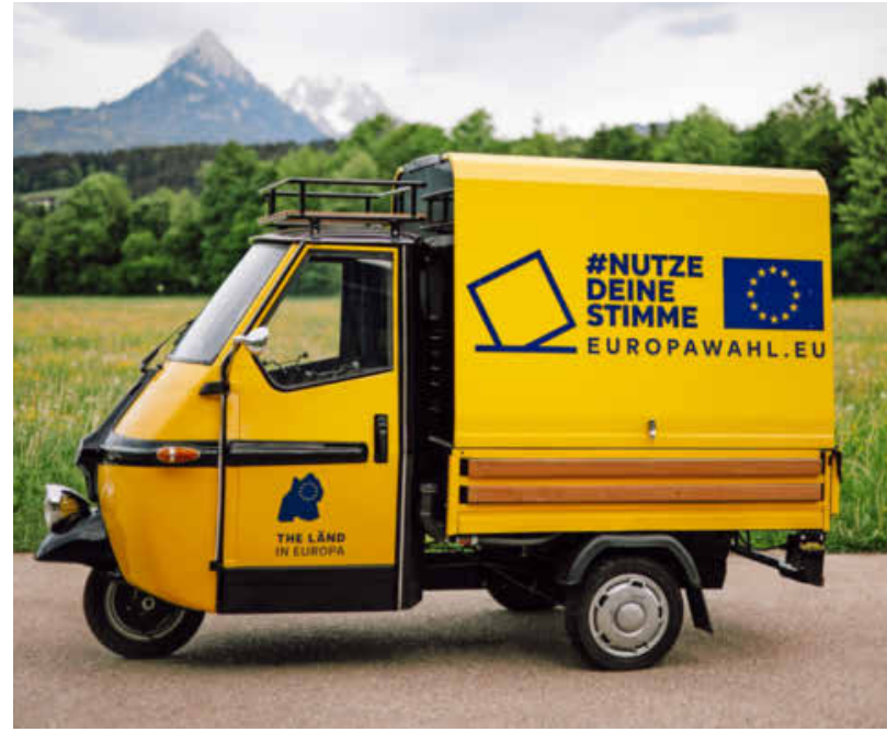
Leckeren Kaffee sowie viele Infos rund um die Europawahl gibt es am 31. Mai auf dem Kiliansplatz.