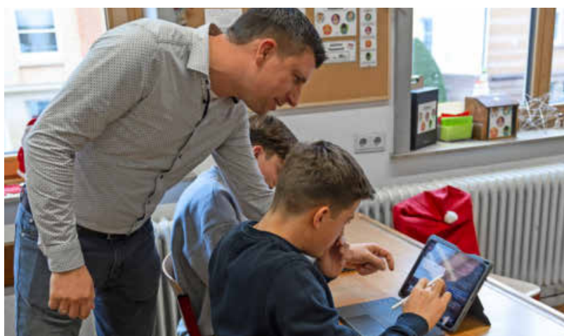
Ende März waren schon 12.000 Tablets in Schulen über die digitale Offensive im Einsatz, hier im Robert-Mayer-Gymnasium.

Start der Tablet-Auslieferung war im Herbst 2024. In einer ersten Charge wurden 24 Schulen beteiligt. Zwischenzeitlich haben alle Schulen in städtischer Trägerschaft ihre Teilnahme an der digitalen Bildungsoffensive signalisiert. (cf)