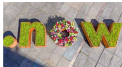
Das Leitmotiv „now“ fürs Hauptstadtjahr 2027.

Im Stadtgebiet entstehen nachhaltige Erlebnisräume: So wird der Marktplatz um das Robert-Mayer-Denkmal durch Entsiegelung und Begrünung zu einer klimaanangepassten Wohlfühloase entwickelt. Mit „Mobilem Grün“ werden versiegelte Innenstadtbereiche in lebendige, grüne Aufenthaltsorte verwandelt. Ein durchgängiger Fahrradring stärkt nachhaltige Mobilität, Verkehrsversuche eröffnen neue Perspektiven für den Stadtraum. Auch Weinberge werden in das Programm integriert: Reallabore, Erlebnispfade und ein internationales Symposium machen den Wandel im Weinbau erlebbar und positionieren die Stadt als innovativen Wein- und Wissensstandort. (mkk)