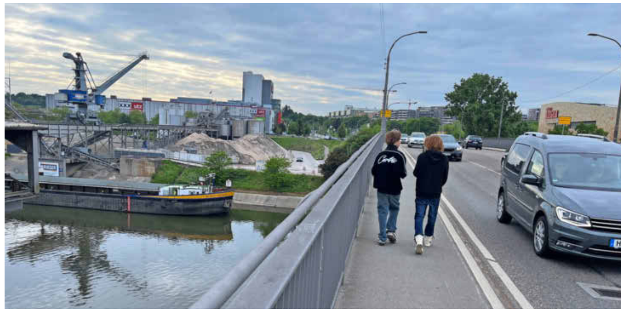
Nach dem Bau der Nordumfahrung kommt der Erneuerung der Peter-Bruckmann-Brücke (Bild) die zweithöchste Priorität beim Ausbau des Hauptverkehrsstraßennetzes zu.

Die Peter-Bruckmann-Brücke ist als Neckarquering ein zentraler