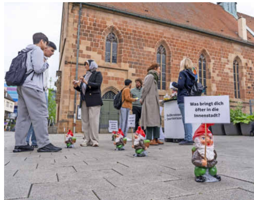
Gut besucht war der Infostand der Bürgerbeteiligung mit drolligen Zwergen in der Innenstadt an der Nikolaikirche.

INFO: Eine Online-Umfrage zum neuen Quartiersbüro läuft bis 31. Juli. Unter https://umfragen.heilbronn.de/533991?lang=de ist die Teilnahme möglich.