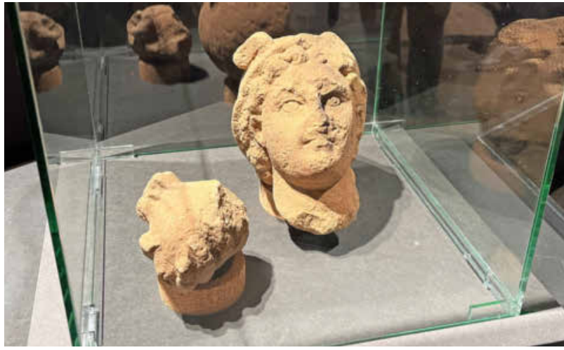
Der spannendste historische Fund: Der Kopf einer römischen Merkur-Gott-Statue mit Resten einer Flügelhaube ist im Deutschhof zu sehen.

Geplant ist, den bisherigen Petrus-Kindergarten in der Kappelstraße sowie das Gemeindezentrum in der Ludwigsburger Straße abzubauen und durch einen Neubau an der Ecke Ludwigsburger Straße / Kappelstraße zu ersetzen. Die Tiefgarage wird über die Klingenbergstraße erschlossen und ist so konzipiert, dass eine spätere Aufstockung, etwa für eine Kurzzeitpflege, möglich ist. (red)