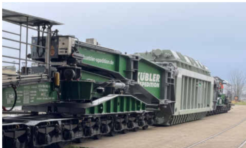
Tonnenschwere Last: Ein Trafo (rechte Bildhälfte) wird hier auf den Gleisen der Hafenbahn transportiert.

haben im Hafengebiet Vorrang und Lokführer stellen an Kreuzungen ihr Signal auf „Grün“ – bisher noch mit einem speziellen Schlüssel am Rand der Gleise. Für die Zukunft ist geplant, vor den Kreuzungen Schlagschalter anzubringen, damit Rangierführer direkt von der Lok aus auf Grün stellen können. Es würde das Stoppen und Anfahren überflüssig machen, Zeit und Treibstoff einsparen.