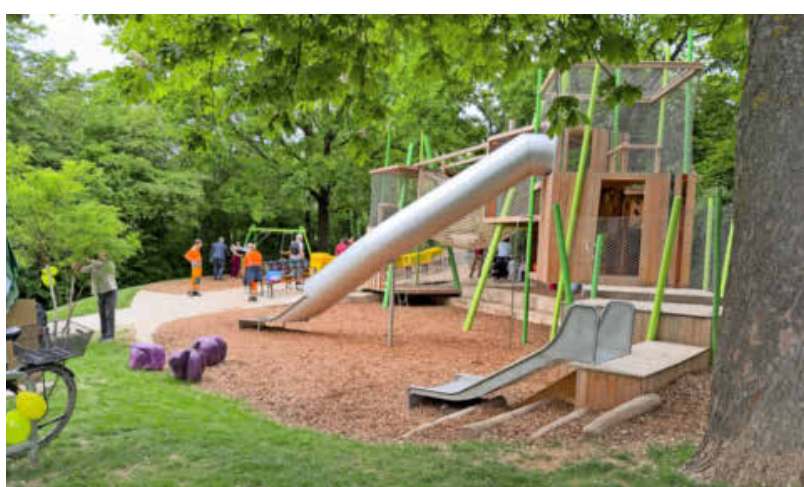
Das große Kombispielgerät mit Hängebrücke ist das Herzstück im sanierten Spielplatz Kohlpfad in der Gruppenbacher Straße.

Rund 900.000 Euro hat die Stadt investiert. Die Maßnahmen sind Teil des Entwicklungsprogramms für Spiel-, Bolz- und Skateanlagen. Ziel ist es, die rund 120 Spielplätze im Stadtgebiet schrittweise zu modernisieren. (ck)