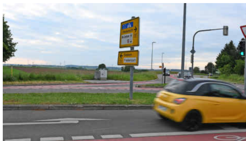
Die Verlängerung der Saarlandstraße könnte in den 2030er Jahren Realität werden und die Verbindung zur B 293 Richtung Leingarten verbessern.

Netzbaustein. Bei dem Neubau geht es insbesondere um die Sicherung langfristiger Tragfähigkeit und Verkehrsqualität. Die Verlängerung der Saarlandstraße stellt eine Option zur Weiterentwicklung des Hauptverkehrsstraßennetzes westlich des Neckars