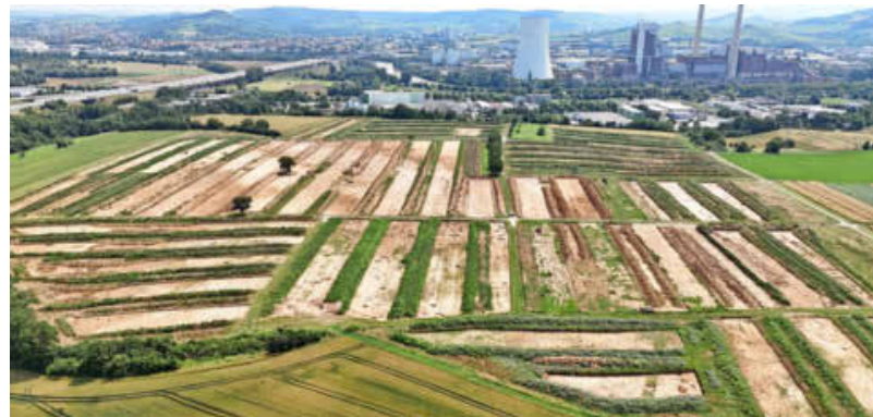
So sah es 2024 vor dem Bau des IPAI aus: die Grabungsflächen der Archäologie im Areal Steinacker.

Nicht nur der Merkurkopf aus Sandstein, auch eine 500 Meter