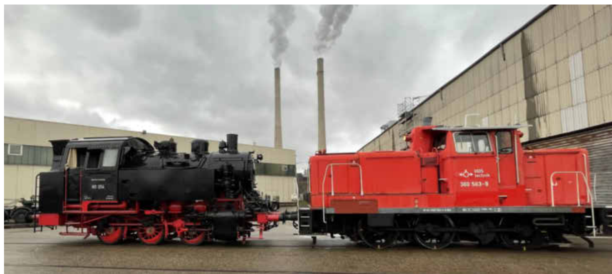
Ein Spezialtransport auf den Hafenbahngleisen: Hier zieht Ende 2021 die Rangierlok eine historische Dampflok aus einem Museum zum Schwergutkai. Per Schiff ging es weiter.

Zugelassene Verkehrsunternehmen können die Nutzung der Gleise gegen eine Gebühr anmelden – und dann mit Rangierloks die Waggons an den Zielort fahren. Im Rangierbahnhof in Böckingen werden die Züge auf kleinere Loks umgeköpelt und rollen mit maximal Tempo 20 über die Gleise der Hafenbahn. Die Schienenfahrzeuge