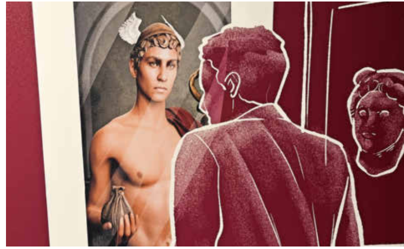
Im IPAI-Besucherzentrum wird Merkur als Avatar zum Leben erweckt – kann sich bewegen und Fragen beantworten.