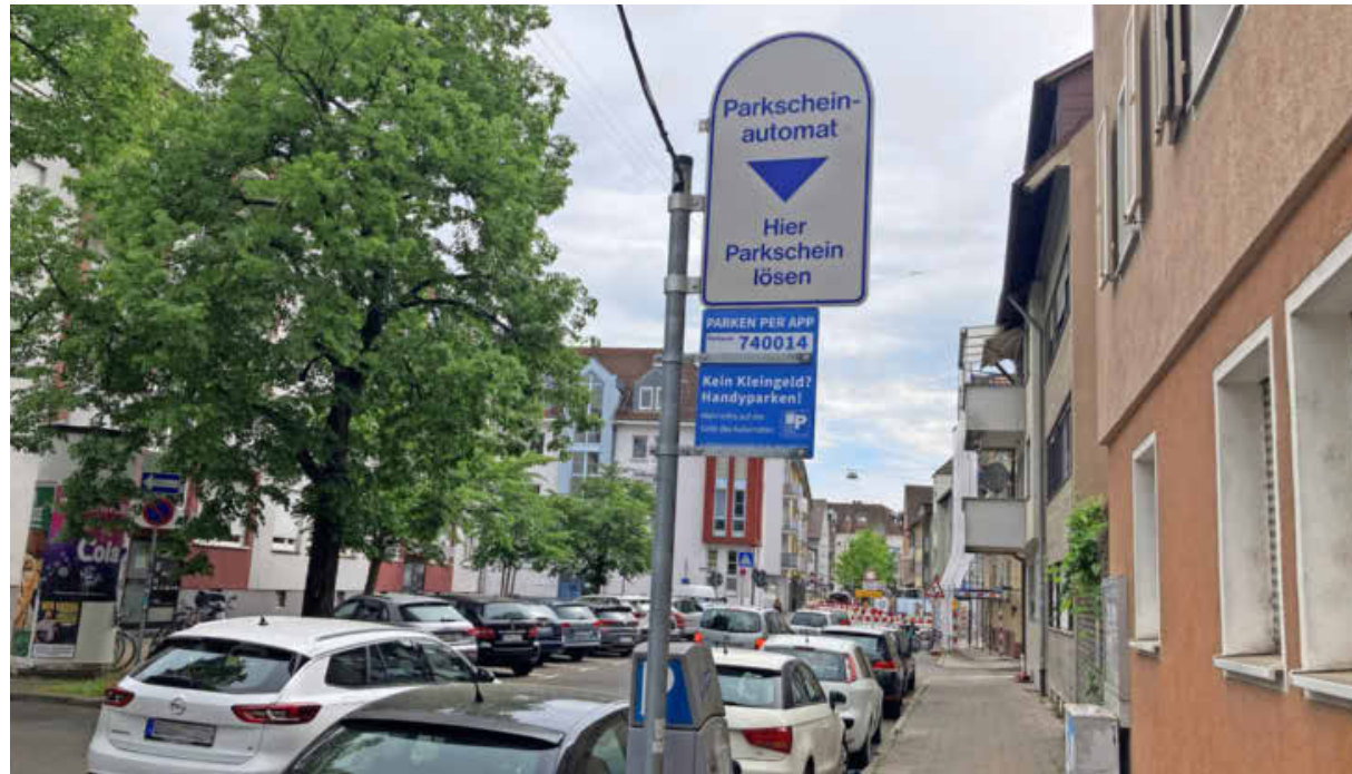
Parken im öffentlichen Straßenraum wird ab Januar 2027 in Heilbronn teurer. Die Parkgebühren werden in der Altstadt täglich sowie in den übrigen Zonen an Werktagen zwischen 8 und 18 Uhr erhoben.

Auch der Zuschnitt der Bewohnerparkzonen wird verändert. Die Zahl der Zonen wird deutlich reduziert, gleichzeitig werden die Zonen vergrößert. Dadurch verbessert sich die Situation für Anwohnerinnen und Anwohner, da sie flexibler innerhalb ihrer Zone parken können. Für Gewerbetreibende und freiberuflich Tätige gelten künftig strengere Regeln. Nach der Rechtslage haben nur Personen Anspruch auf einen Bewohnerparkausweis, die im Gebiet gemeldet sind und dort wohnen. Ausnahmegenehmigungen für Unternehmen bleiben möglich, bestehende Genehmigungen werden im Rahmen des Bestandschutzes anerkannt. Zuständig für