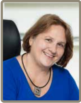
Theresa Schopper Ministerin für Kultus, Jugend und Sport Baden-Württemberg